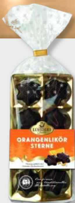
245 Orangenlikör-Sterne Gefüllt mit edlem Orangenlikör in Bitterschokolade *