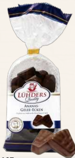
167 Ananas-Gelee Ananas-Gelee umhüllt von feinsten Bitterschokolade *