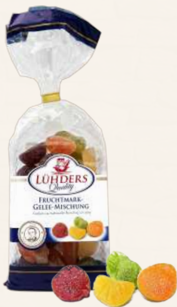
98 Fruchtmark-Gelee Gelee gezuckert, mit 25% Fruchtsaft- und Fruchtpüreeanteil