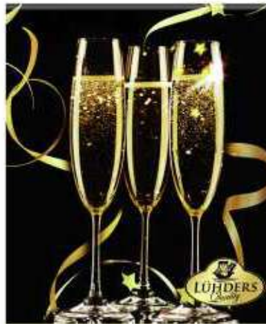
Deluxe-Bärchen Mit 2% Champagner