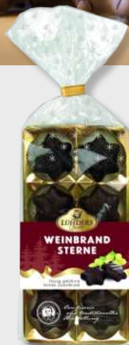
247 Weinbrand-Sterne Klassische Kombination von edlem Weinbrand und Bitterschokolade *