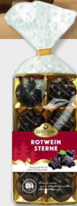
248 Rotwein-Sterne Gefüllt mit gereiftem Rotwein in Bitterschokolade *