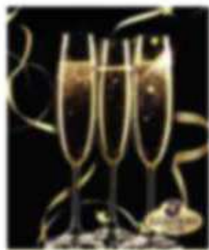
Deluxe-Bärchen Mit 2% Champagner