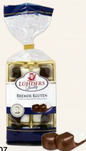
207 Bremer Kluten Fein kandierter Pfefferminz- Fondant mit 12% Bitterschokolade *