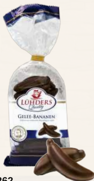
262 Gelee-Bananen Feines Gelee umhüllt von feinsten Bitterschokolade *