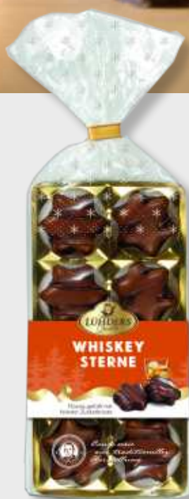
246 Whisky-Sterne Edler Whisky in Vollmilchschokolade mit 35% Kakao in der Schokolade