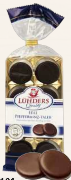
161 Pfefferminz-Taler Praline aus Fondant mit natürlichem Pfefferminzöl in Bitterschokolade *