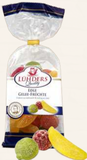
101 Gelee-Früchte- Mischung Edle Gelee-Früchte- Mischung, fein gezuckert